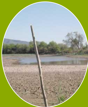
Aprovechamiento de escurrimientos superficiales