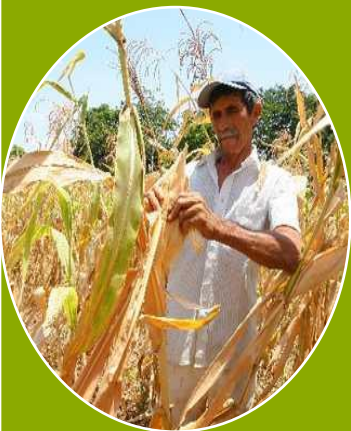
Agricultura de temporal y subsistencia