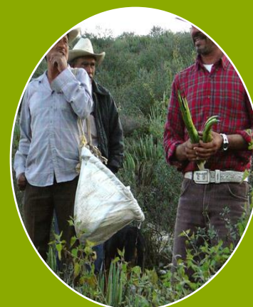
Recolección de no maderables